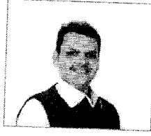
देवेन्द्र फडणवीस मा. मुख्यमंत्री